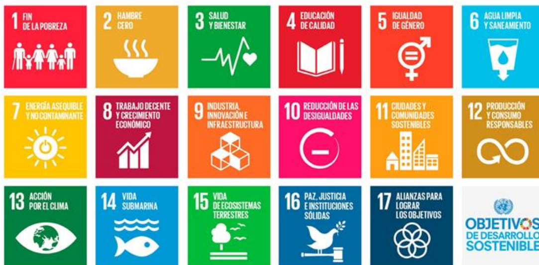
Imagen 1: representación gráfica de los Objetivos de Desarrollo Sostenible