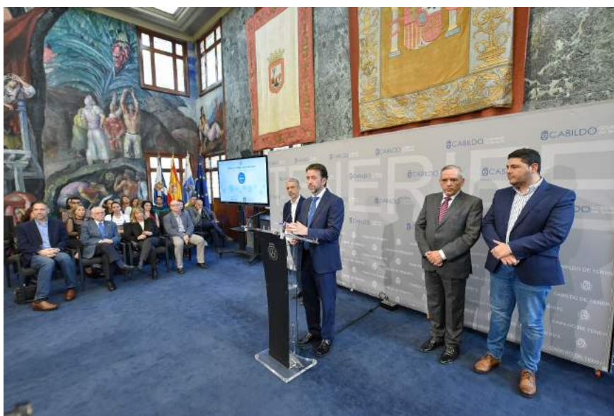
Presentación de Barrios por el Empleo: Juntos más Fuertes 2018.

El presidente insular indicó que se trata del proyecto más relevante dentro de la estrategia Cabildo Emplea, "que se dirige al colectivo con más dificultades para encontrar trabajo y tiene una manera distinta e innovadora de hacer las cosas. Es algo que evoluciona, que funciona porque se trabaja colaborativamente entre todos los agentes, porque es flexible a la hora de disponer de