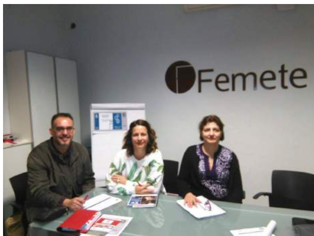
Generación de sinergias con Femete

Fundación Proyecto Don Bosco se reúne con la patronal del metal y nuevas tecnologías para percibir las oportunidades de empleo en el sector.