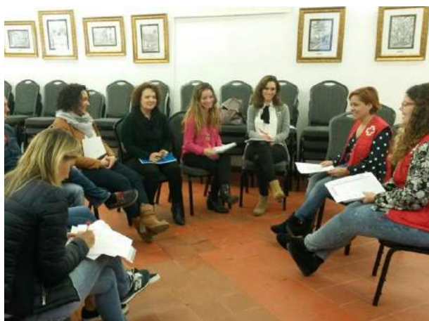
Reunión de los agentes zonales de Garachicho

La Fundación General la ULL presentó la experiencia del proyecto en las jornadas organizadas por el Proceso Intercultural Zona Sur de Jerez.