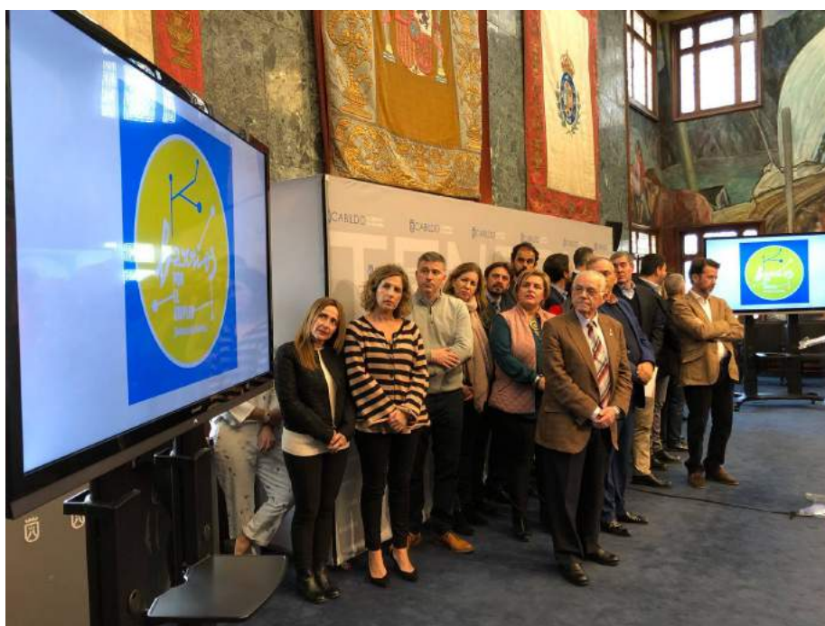
Barrios por el Empleo: Juntos más Fuertes, protagonista en 'Cabildo Emplea'

El presidente del Cabildo, Carlos Alonso, presentó, en compañía del presidente del Gobierno de Canarias, Fernando Clavijo, la estrategia de empleo insular para 2018 que, bajo el lema 'Cabildo Emplea. Generando oportunidades', persigue que se cree en la Isla empleo de calidad y duradero. Se trata de una tendencia que se ha conseguido mantener en los últimos años y que en esta ocasión contará con una inversión total que rondará los 17 millones de euros (frente a los 14 de 2017). De igual modo, el número de beneficiarios previstos asciende a 4.000 y el de inserciones a 2.500. Todo ello se sustenta, en gran medida, en el Marco Estratégico de Desarrollo Insular (Medi), que es el plan que define el desarrollo de Tenerife para los próximos años y que está financiado por el Fondo de Desarrollo de Canarias (Fdcan).