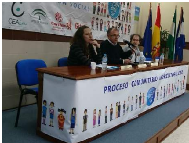
Presentación del proyecto en Jerez de la Frontera

Fundación Proyecto Don Bosco se reúne con la patronal del metal y nuevas tecnologías para percibir las oportunidades de empleo en el sector.