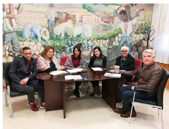
Presentación de resultados en el municipio Arafo

Cruz Roja Española participa en la reunión de los agentes zonales del municipio, con el objetivo de seguir trabajando coordinadamente en este territorio.