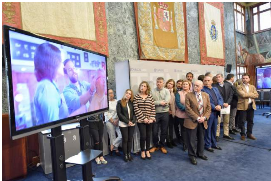
La presentación de la estrategia tuvo lugar en el Salón Noble del Cabildo.

ayuntamientos ha sido la de destinar parte de los recursos del Fdcan a un total de 82 programas y proyectos que se están llevando a cabo en todas las islas, con el objetivo de fomentar la creación de empleo de calidad y la mejora de la inserción laboral de los colectivos más vulnerables”. Los principales objetivos de la estrategia de empleo insular