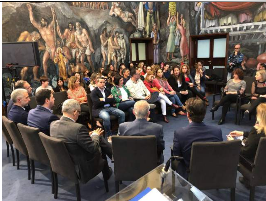
Encuentro con todo el personal del proyecto para intercambiar experiencias

En la actualidad, este proyecto cuenta con 21 nodos de atención y formación distribuidos por toda la geografía insular, especialmente en los puntos con mayores tasas de desempleo o a los que no llegan los recursos normalizados de empleo, que dan cobertura a todos los municipios. ‘Barrios por el Empleo: Juntos más Fuertes’ se ha convertido en un puente que une a las personas que buscan un empleo con las empresas que necesitan contratar personal. En este sentido, la cooperación con el sector empresarial es una de las claves del éxito de ‘Barrios por el Empleo: Juntos más Fuertes’, ya que la formación impartida se diseña en base a los perfiles profesionales que necesitan incorporar las empresas con el objetivo de facilitar inserciones.